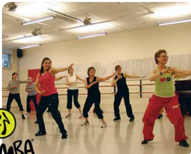
I danssalen på Mimershus i Kungälv.